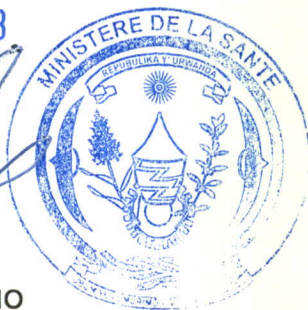
Dr Agnes BINAGWAHO Ministre de la Santé